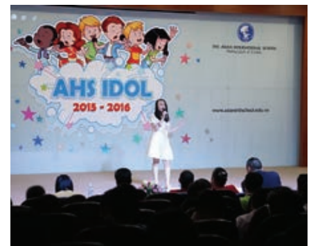
Khuấy động không gian âm nhạc và tự tin làm chủ sân khấu

AHS Idol không chỉ là sân chơi bổ ích để học sinh rèn luyện tiếng Anh, thể hiện niềm đam mê ca hát, mà còn là nơi chấp cánh cho những giọng ca tài năng và khơi nguồn cảm hứng cho những màn trình diễn nghệ thuật đẹp mắt, hấp dẫn.