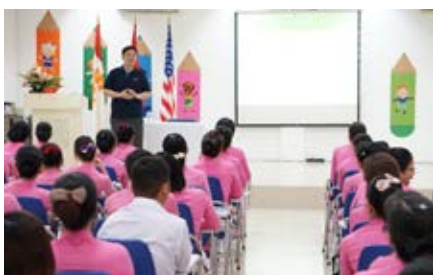
Đại diện NXB Cengage chia sẻ kinh nghiệm khai thác thư viện điện tử cho giáo viên Bạc Tiểu học IPS và Bạc Trung học AHS

Trong 2 ngày 17 & 19/12/2015, Trường Quốc tế Á Châu phối hợp với NXB Cengage - Hoa Kỳ tổ chức cho giáo viên Bạc Tiểu học IPS và Bạc Trung học AHS chương trình tập