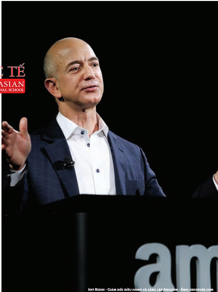
JEFF BEZOS - GIÁM ĐỐC ĐIỀU HÀNH VÀ SÁNG LẬP AMAZON