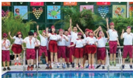
Học sinh Bậc Tiểu học IPS hào hứng tham quan Bậc Trung học AHS

Trong 2 ngày 13 & 14/4/2016, hơn 700 học sinh Bậc Tiểu học IPS Trường Quốc tế Á Châu đã hào hứng tham gia Ngày hội tham quan Bậc Trung học AHS.