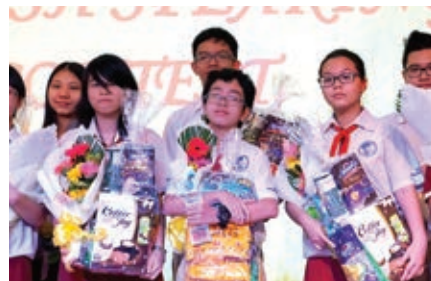
Các thí sinh trong phần trao giải thưởng sau cuộc thi

Ngày 20/02/2016, tại cơ sở Cao Thắng đã diễn ra vòng chung kết hệ thống cuộc thi Hùng biện tiếng Anh 2016 (English Speaking Contest) do Bậc Trung học AHS Trường Quốc tế Á Châu tổ chức.