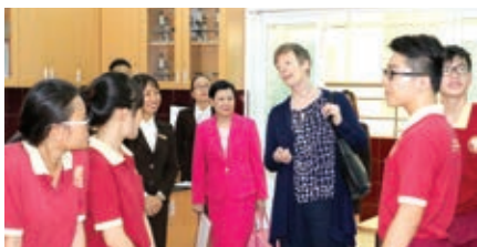
Đại diện Đại học Aberystwyth tham quan trường và trò chuyện cùng học sinh

Ngày 15/3/2016, đại diện Đại học Aberystwyth (Vương quốc Anh) đã có chuyến thăm và làm việc thân mật cùng đại diện Trường Quốc tế Á Châu. Chuyến thăm nhằm mục đích tìm hiểu và mở rộng mối quan hệ hợp tác giáo dục song phương giữa 2 trường.