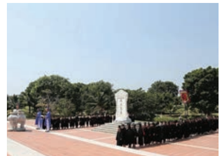
Quàng trường Văn Miếu

Ngày 05/3/2016, sinh viên khóa 5, 6, 7 ĐH và sinh viên khóa 6 CĐ đã tham gia nghi thức dâng hương tại Khu truyền thống - dã ngoại Trường Đại học Quốc tế Sài Gòn tại Thị xã Long Khánh - Đồng Nai.