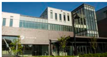
Humber College