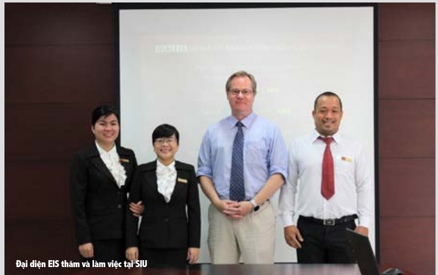
Đại diện EIS thăm và làm việc tại SIU

Ngày 22/01/2016, đại diện Trường Quốc tế Châu Âu (European International School - EIS) đã có chuyến thăm và làm việc trực tiếp cùng đại diện của Trường ĐH Quốc tế Sài Gòn. Buổi gặp gỡ đặt dấu mốc quan trọng về mối quan hệ tốt đẹp giữa SIU và EIS. Trong buổi làm việc, đại diện EIS đánh giá cao môi trường đại học chất lượng quốc tế tại SIU và bày tỏ nguyện vọng được SIU tạo điều kiện để học sinh EIS tham gia học tập bậc đại học trong thời gian tới.