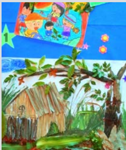
Các tác phẩm được trưng bày tại các khu vực triển lãm tranh trong khuôn viên sân trường

Kết thúc cuộc thi, Ban giám khảo đã chọn ra 20 giải tranh đẹp, trong đó 10 giải cho Bậc Tiểu học IPS và 10 giải cho Bậc Trung học AHS; một giải bình chọn cho tác phẩm được thí sinh tham dự vòng chung kết bình chọn; 2 giải sáng tạo và 2 giải ấn tượng.