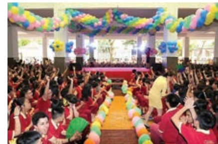
Sân khấu Singing with stars náo nhiệt trước giờ khai mạc

Sân khấu Singing with stars năm nay đặc biệt “nóng” hơn bao giờ hết khi có sự xuất hiện của rất nhiều vị khách mời nổi tiếng như: ca sĩ Noo Phước Thịnh, Minh Hằng, Trúc Nhân, Thanh Duy, Hari Won, Soobin Hoàng Sơn; nghệ sĩ hài Trường Giang, Hoàng Sơn,