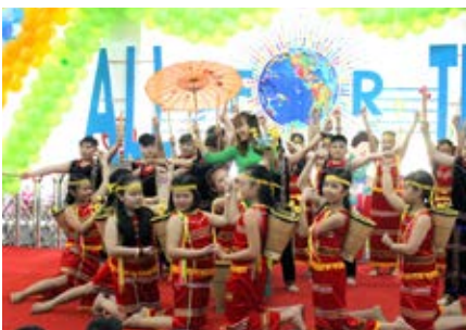
Vũ điệu Tây Nguyên