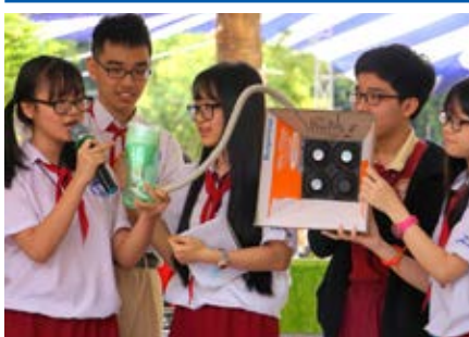
Các bạn học sinh AHS thuyết trình sản phẩm dự thi

Sáng 30/3, ngày hội “Học sinh THCS với sáng tạo khoa học” do Phòng GD&ĐT Quận 1 tổ chức đã diễn ra tại Trường THCS Trần Văn Ôn. Sự kiện thu hút sự tham gia của hơn 720 học sinh các trường THCS trên địa bàn Quận 1 với gần 20 sản phẩm, mô hình nghiên cứu, sáng tạo tham gia tranh tài. Trong đó, học sinh Bắc Trung học AHS Trường Quốc tế Á Châu đã giới thiệu mô hình “máy hút khói” do chính các bạn sáng tạo trong trạm thi “Ý tưởng khoa học”.