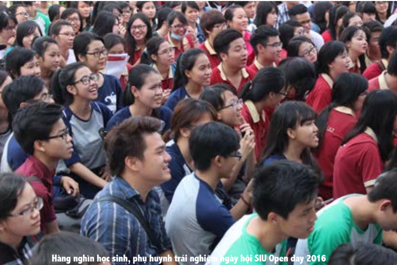
Hàng nghìn học sinh, phụ huynh trải nghiệm ngày hội SIU Open day 2016