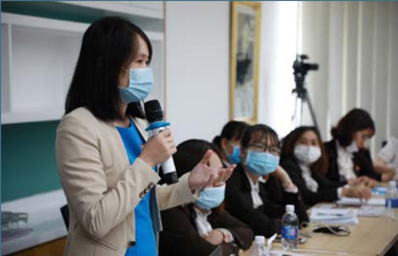
Ban Giám hiệu, quản lý, giảng viên, nhân viên SIU đặt nhiều câu hỏi về chuyển đổi số trong giáo dục đại học