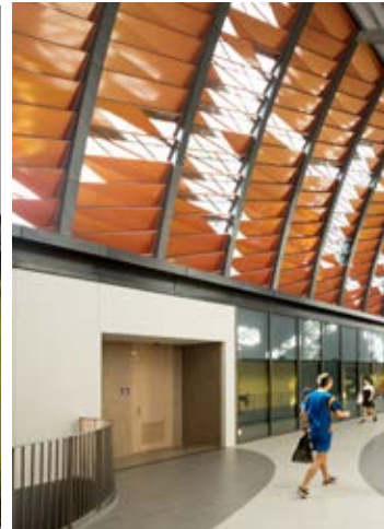
Cơ sở vật chất tại Bukit Timah Campus

Bên cạnh đó, trường còn là một trong những trung tâm nghiên cứu khoa học xuất sắc ở nhiều lĩnh vực. Thông qua sự hợp tác của các khoa, trường và viện nghiên cứu, NUS đã xây dựng 8 khu nghiên cứu tích hợp. Những nghiên cứu của trường tập trung vào lão hóa, Đông Phương học, y học, sinh dược học, tài chính và quản lý rủi ro, các giải pháp bền vững tích hợp, hàng hải