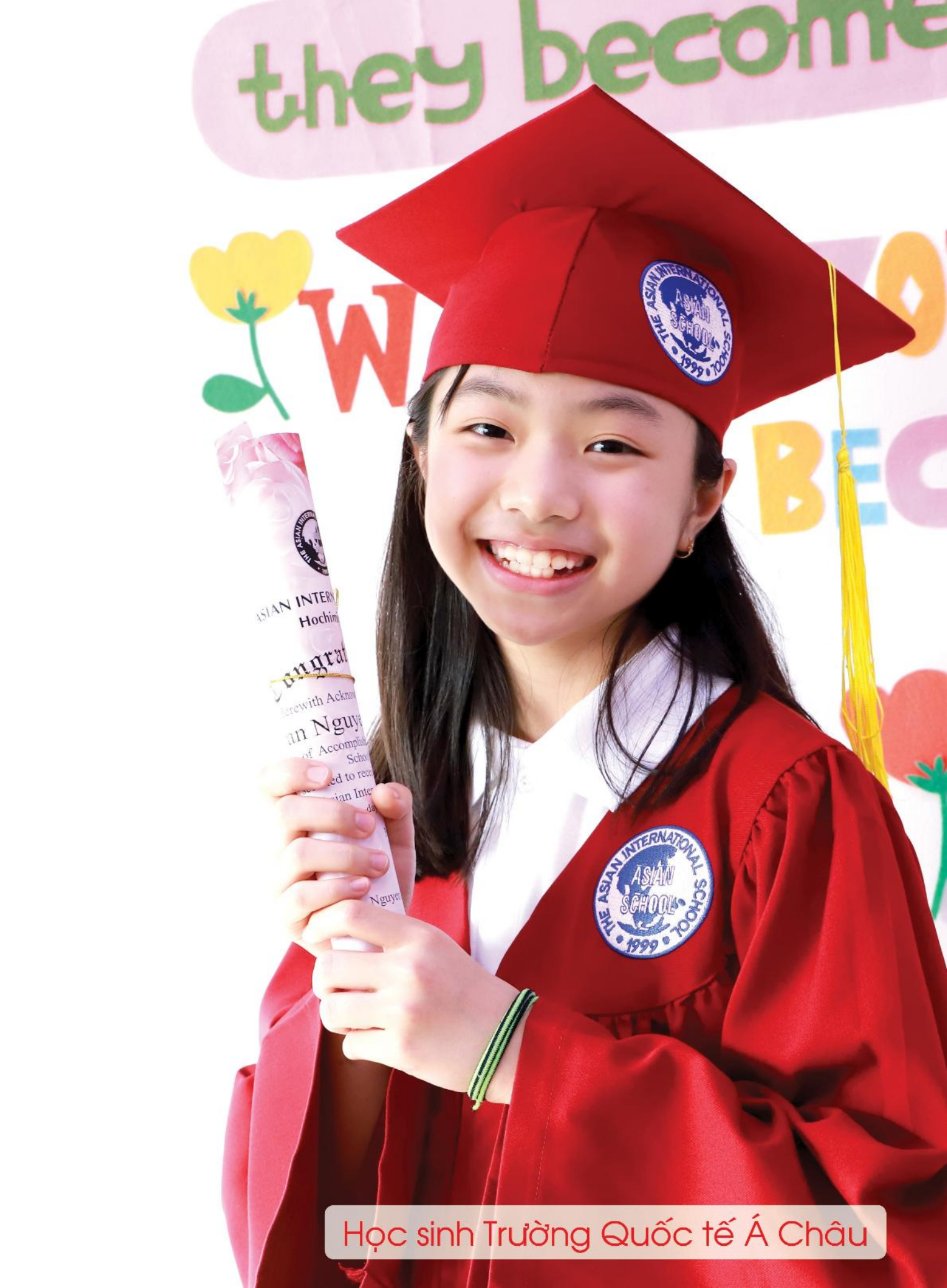
Học sinh Trường Quốc tế Á Châu