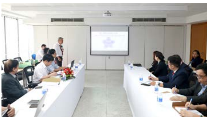
Hội thảo có sự tham dự của đại diện Hội đồng trường, Ban Giám hiệu, lãnh đạo các đơn vị và đặc biệt là các chuyên gia đầu ngành