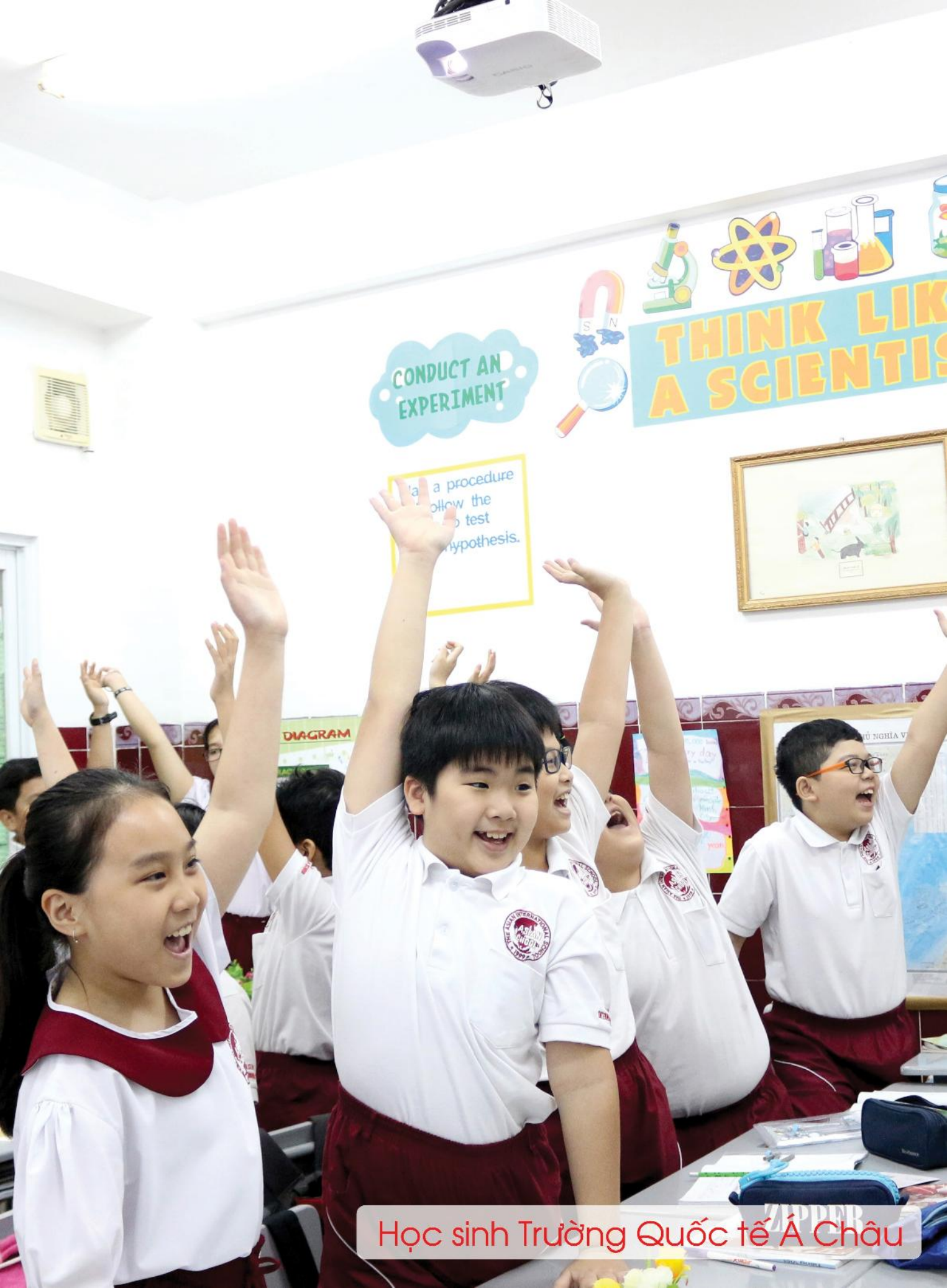
Học sinh Trường Quốc tế Á Châu