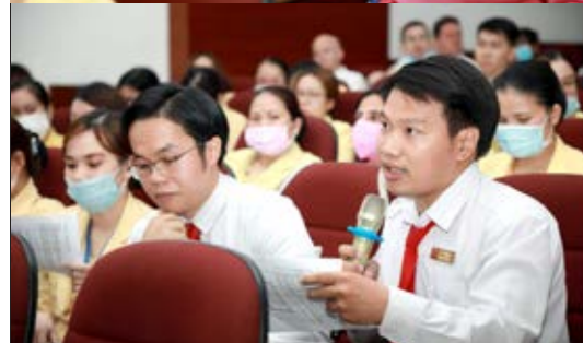
Hội thảo là nơi giáo viên chia sẻ ý kiến của mình về an toàn thông tin, an ninh mạng và bảo vệ trẻ em