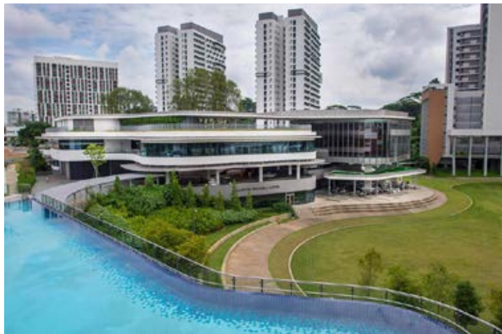
Khuôn viên rộng lớn, khoảng 150 ha, được gọi là Làng đại học Quốc gia Singapore

Trường có 3 cơ sở - Kent Ridge, Bukit Timah and Outram - tọa lạc ở khu Kent Ridge gần ven biển, cách khu trung tâm Downtown Core khoảng 10 km về phía Tây và nằm ngay cạnh ga Kent Ridge. Sinh viên có thể dễ dàng đi lại giữa sân bay, trung tâm thành phố và trường đại học nhờ hệ thống tàu điện ngầm MRT và xe bus tiện lợi phủ khắp đảo quốc sư tử.