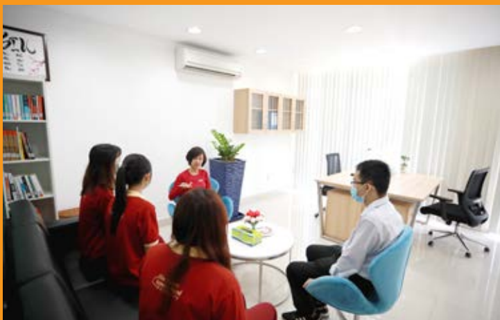
Tham vấn tâm lý & hướng nghiệp Trường Đại học Quốc tế Sài Gòn (SIU)

Theo học chuyên ngành Tâm lý học tham vấn & trị liệu tại SIU, sinh viên được trau dồi và phát triển các kỹ năng phân tích, đánh giá thông tin; giao tiếp, tham vấn; làm việc nhóm, tổ chức, sắp xếp công việc khoa học, tư duy sáng tạo... thông qua hoạt động học tập, ngoại khóa, đặc biệt là các bài giảng, hội thảo ở trình độ cao do các giáo sư, tiến sĩ đầu ngành và các giảng viên nhiều năm kinh nghiệm hướng dẫn... Ngoài ra, sinh viên còn có cơ hội trải nghiệm thực tế nghề nghiệp tại các bệnh viện, trung tâm tham vấn trị liệu tâm lý, doanh nghiệp, trường học...; được trang bị kiến thức và kỹ năng đa dạng để thích ứng với mọi bối cảnh đặc thù và làm việc tốt với cá nhân hoặc nhóm thân chủ khác nhau.