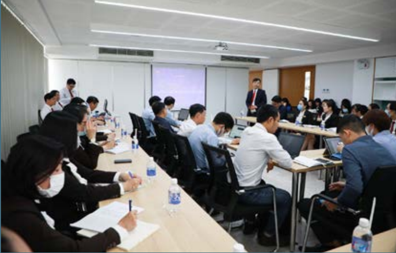
Hội thảo “Digital Transformation In Higher Education” diễn ra vào sáng 27/4 tại SIU

Hội thảo có sự góp mặt của Ban Giám hiệu lãnh đạo và nhân viên các đơn vị, giảng viên các Khoa, giám đốc các cơ sở của Tập đoàn Giáo dục Quốc Tế Á Châu (GAIE).